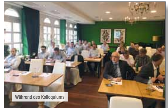
Während des Kolloquiums

bleiben wird, sondern dass wir dies regelmäßig stattfinden lassen werden, um dem Verfahren mit so einem großen Anwendungspotenzial ein