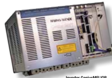
Inverter GeniusMFI IQR

Neue X Pegasus: Mit weniger Klicks zu noch mehr Funktionalität.