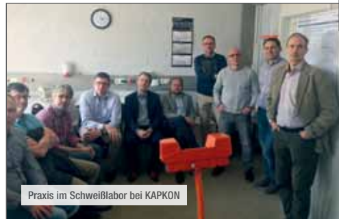
Praxis im Schweißlabor bei KAPKON