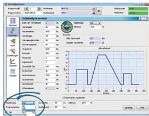
Auswahl des Regelmodus IQR in der KSR-Bedienmaske

Seit einigen Tagen ist nun die neueste Version der X Pegasus 5.0 verfügbar, die neben der Einbindung neuer Features starken Fokus auf eine einfache,