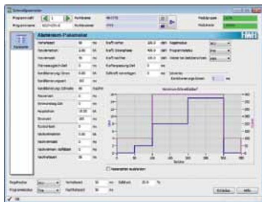
Beispiel Bedienmaske AMC für GENIUS

dass Sie Ihre Steuerungen jetzt schneller und noch komfortabler programmieren können. Als nächstes haben wir weitere Features zur schnelleren Bedienung